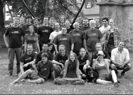
Das Team der Welle West Wetterau zur Landesgartenschau in Bad Nauheim.

Feuerwerk und beeindruckenden Illuminationen.